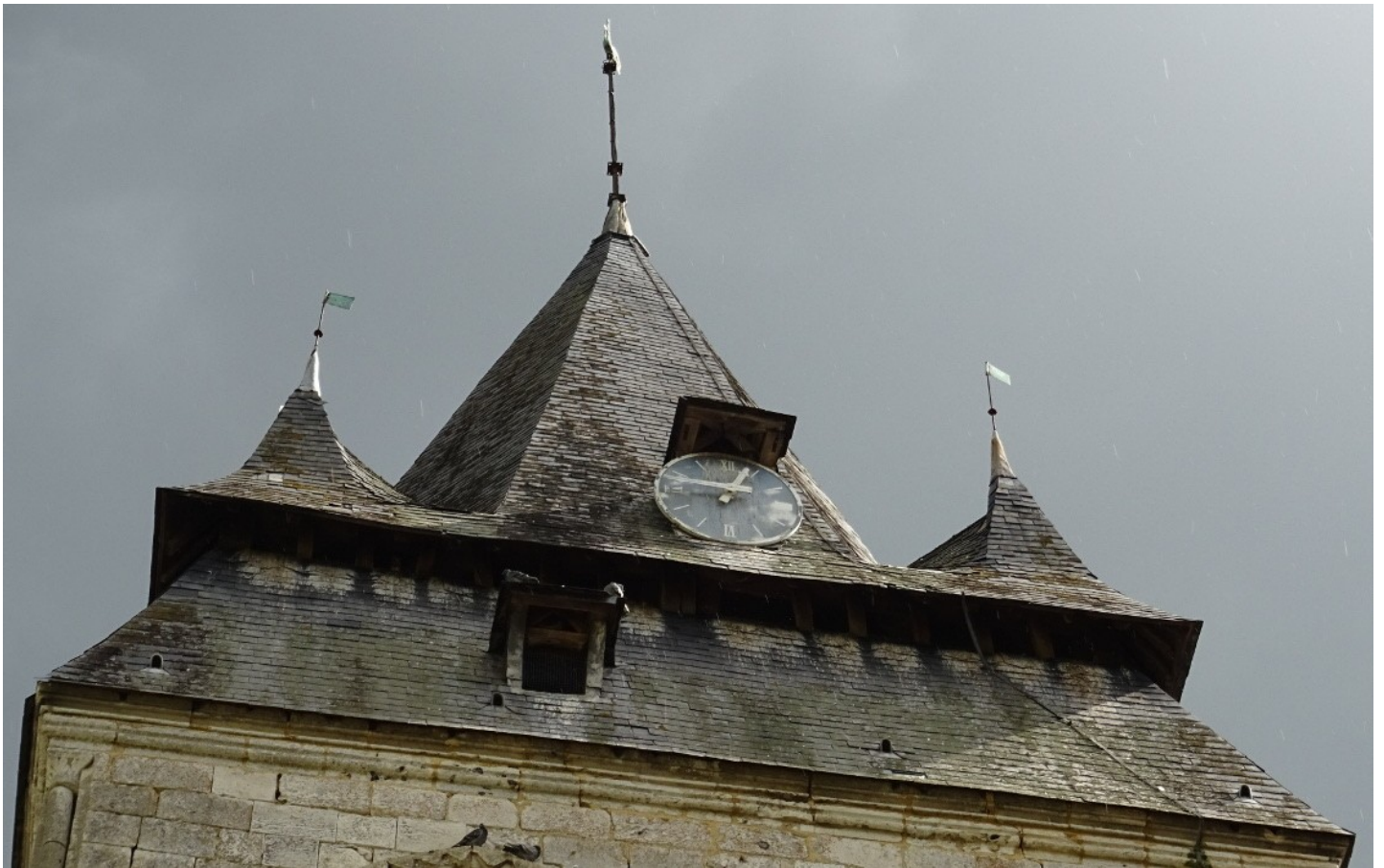
Photographie du monument historique